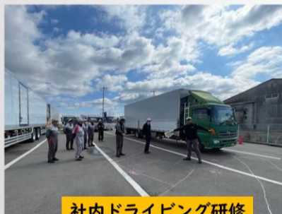
社内ドライビング研修