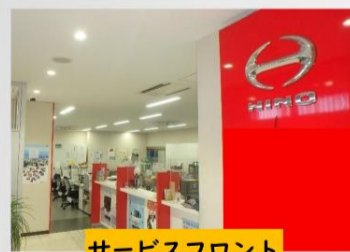
サービスフロント