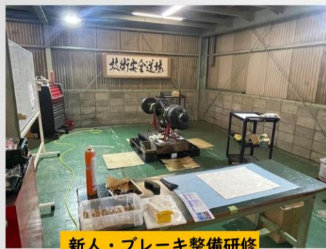
新人・ブレーキ整備研修