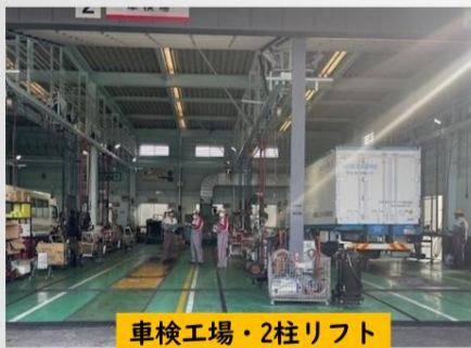
車検工場・2柱リフト